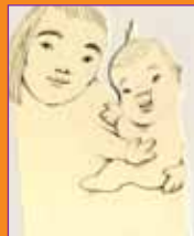
Milanka Fabjančič, avtoportret