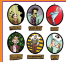
Milanka Fabjančič: Tipi fantov