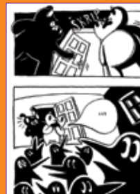
Matej Lavrenčič: Male črne skrbi