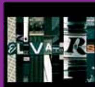
Elevators Elevators Celinka.si, 2008