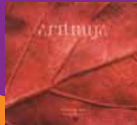
Gonilna sila Aritmija Celinka.si, 2007