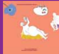
V živo iz Stare elektrarne Mljask Celinka.si, 2008