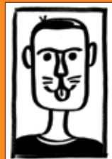
Matej Lavrenčič, avtoportret