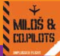
Unplugged flight Miloš & Co.pilots Celinka.si, 2009